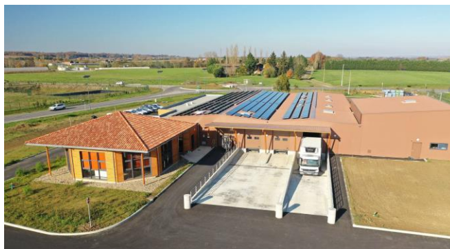
Nouvel entrepôt de Cabso