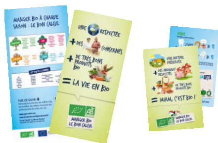
Dépliants adultes et enfants