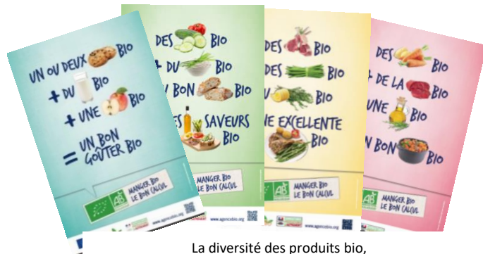
La diversité des produits bio, pour une alimentation bio variée et équilibrée