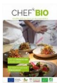
Le magazine Chef & Bio