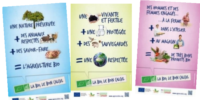
La Bio : un engagement global